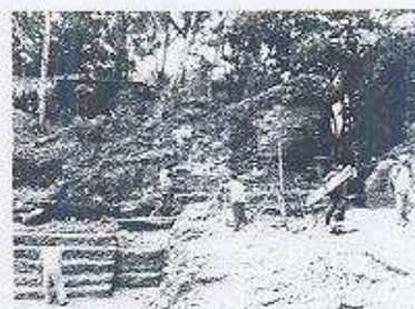
Fachada norte trabajos de restauración en proceso