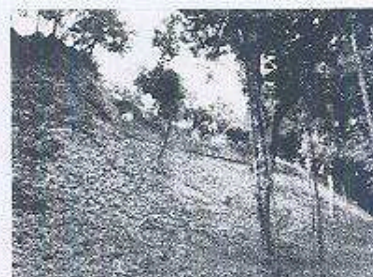
Trabajos de control de vegetación en la fachada norte de la acrópolis central